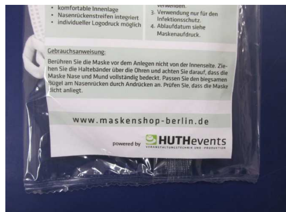
Gebrauchsanweisung / User manual