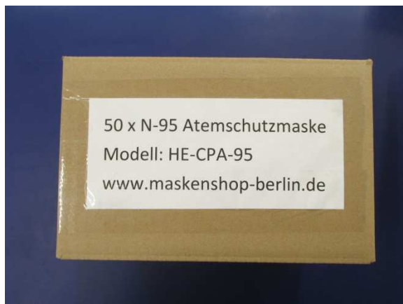
Verpackung / Packaging

Die folgende Maske wurde geprüft / The following mask was tested: