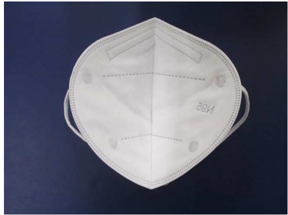
Innenansicht / Inner view