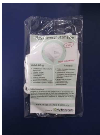
Verpackung / Packaging