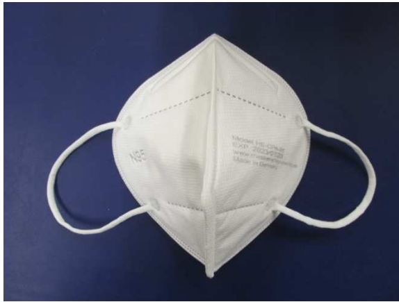
Frontansicht / Front view