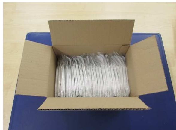
Verpackung / Packaging