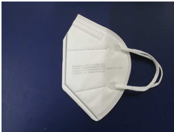
Seitenansicht / Side view