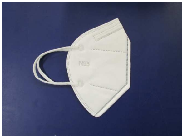
Seitenansicht / Side view